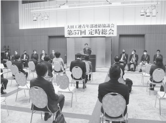
第57回青年部定時総会

発行所 東京都大田区南蒲田1-20-20 電話(3737)0797・FAX(3737)0799 一般社団法人大田工業連合会 発行人会長 広瀬安宏 E-mail: office@ootakoren.com ホームページ: https://ootakoren.com 印刷所 東京都大田区大森西4-6-13 電話(3766)1711 株式会社 気生堂印刷所